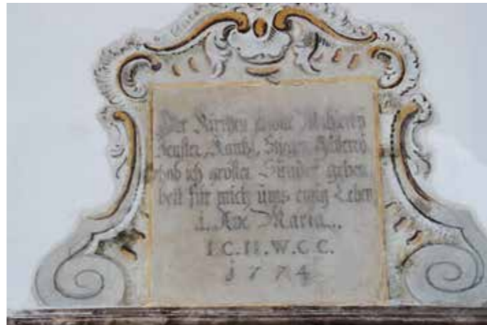
Die Solnhofer Platte über dem Eingang zur Kanzel mit der Jahreszahl 1774.