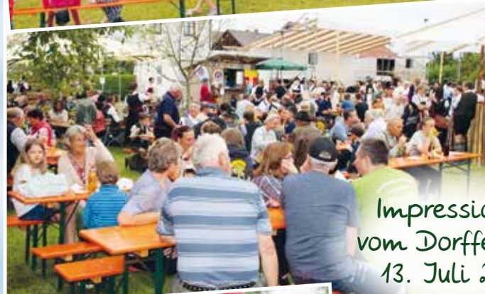
Impressionen vom Dorffest am 13. Juli 2024