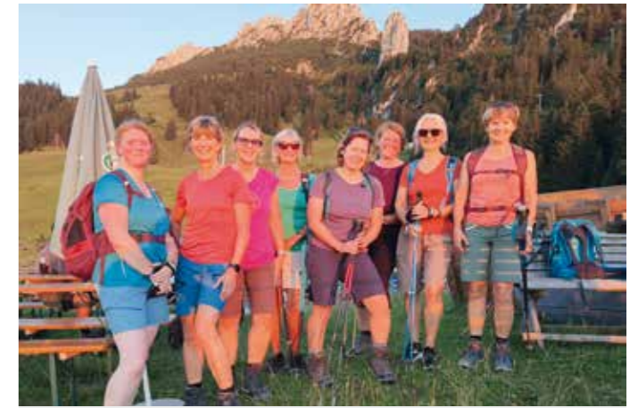
Die Teilnehmerinnen der Abendwanderung auf der Gori-Alm.